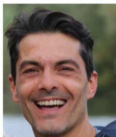
Referente del progetto di Lucca 335 8075164